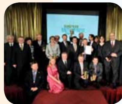
Ganadores de los Premios Europeos de la Empresa 2009

El apoyo a la internacionalización de las empresas no ha atraído mucha participación al concurso, sobre todo a nivel regional. Esto demuestra que, aunque el tiempo y coste medio para establecer un negocio se ha reducido en la mayoría de los países europeos, aún queda mucho por hacer en este área. Finalmente, la categoría para una iniciativa empresarial responsable e inclusiva ha puesto en el punto de mira proyectos interesantes como la promoción de empresas sociales, especialmente entre grupos desaventajados o personas con discapacidades mentales o físicas, así como proyectos que promueven activamente la ética y la responsabilidad corporativa en pequeños negocios.